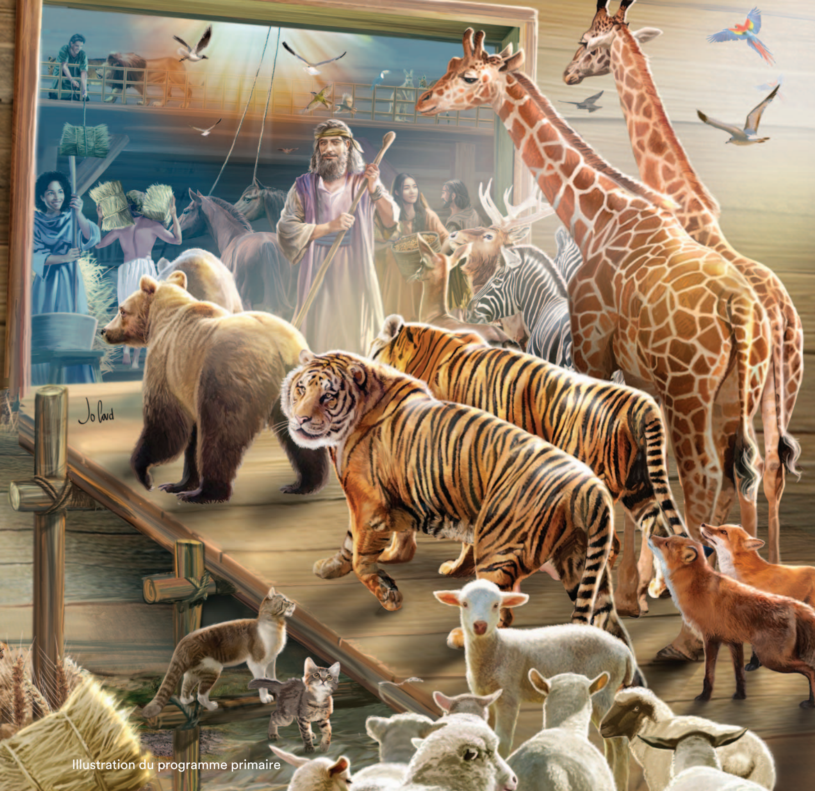
Illustration du programme primaire

Dans cette dernière étape, les enfants auront l'occasion de reconnaître et de célébrer ce qu'ils ont appris de Dieu dans sa Parole, ou ce qu'il a fait pour eux ou pour quelqu'un d'autre (dans le contexte de la mission). Ce court segment peut prendre la forme d'une louange des enfants louant Dieu pour ce qu'il a fait, reconnaissant les enfants pour ce qu'ils ont appris, ou une courte application thématique qui apporte la joie aux enfants.